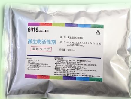
微生物活性栄養剤