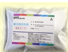
「微生物活性栄養剤」 500g/袋